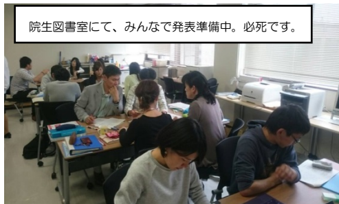
院生図書室にて、みんなで発表準備中。必死です。

一番の喜びは普通にいらしていただけなかった、たくさんの出会い！個性的で、熱心で、やさしい仲間たち(^^)これまでの実践について、理論的に振り返ることができてすごく勉強になります。ストレートマスターのみなさんの若い感性や広い知識に大きな刺激も受けています。また、現職教員同士の対話でも、中学校や高校の情報を聞けるので、改めて子どもたちの進路や成長についても考えさせられることが多いです。