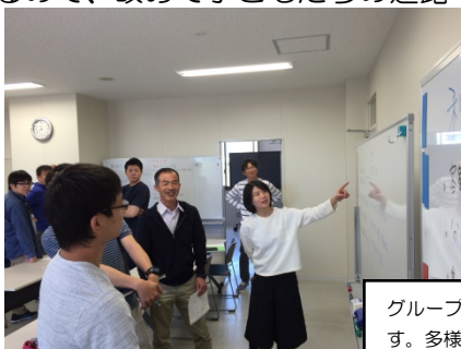
グループ討議で出た意見や考えをみんなで共有します。多様な意見に発見がたくさんあります。