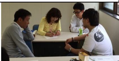
授業を担当する大学の先生にもグループ討議に参加していただきました。